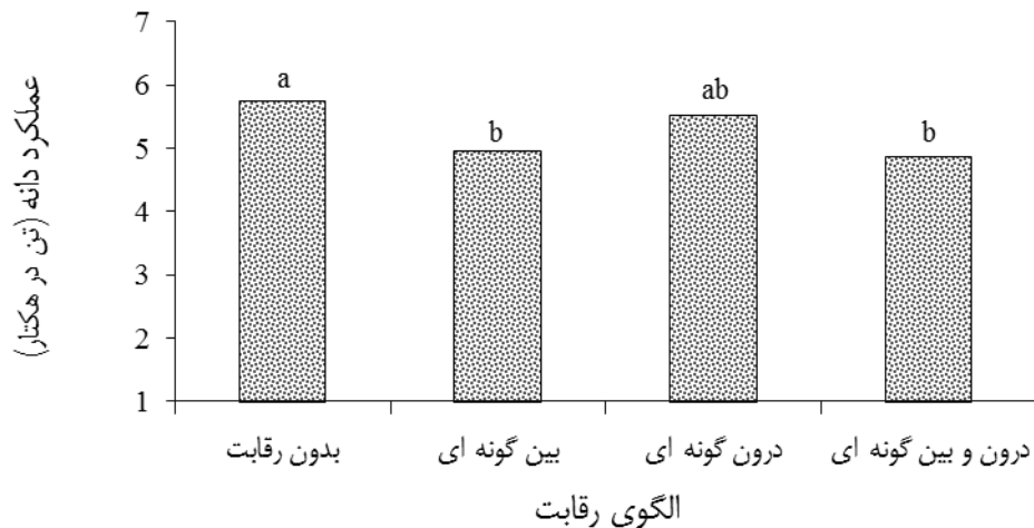
شکل ۲- اثر سطوح مختلف الگوی رقابت بر عملکرد دانه