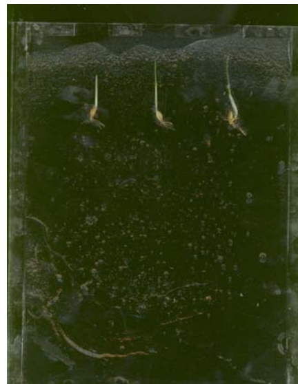
شکل ۱- اتاقک ژل حاوی جوانه‌های جو (نمونه حاضر تیمار شوری ۰/۲ مولار نمک است و از چپ به راست تیمارهای شاهد، هیدروپرایم و پرایمینگ با اوره قرار دارند).

مدت ۶ ساعت در محلول‌های تهیه شده قرار داده شدند. در پایان بذرها سه مرتبه با آب مقطر شسته شده و به مدت ۲۴ ساعت در دمای آزمایشگاه (۲۰ درجه سانتی‌گراد) پهن گردیدند تا رطوبت آن‌ها تا ۱۴ الی ۱۶ درصد کاهش یابد. سپس به منظور جوانه‌زنی اولیه، بذور مربوط به هر تیمار در ظرف‌های پتری استریل روی کاغذ صافی واتمن شماره یک قرار داده شده و مقداری آب مقطر به ظروف پتری اضافه گردید. پس از جوانه‌زنی بذر، گیاهچه‌های عادی و نماینده جمعیت تیمار مورد نظر به اتاقک‌های حاوی فیتوژل (Sigma) منتقل گردید (۹). دلیل استفاده از فیتوژل، شفافیت و گران روی بالای آن بود که امکان تثبیت بذر و تهیه تصاویر با کیفیت مناسب را فراهم می‌نمود.